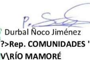
Durbal Noco Jiménez ?>Rep. COMUNIDADES ' V\|RÍO MAMORÉ